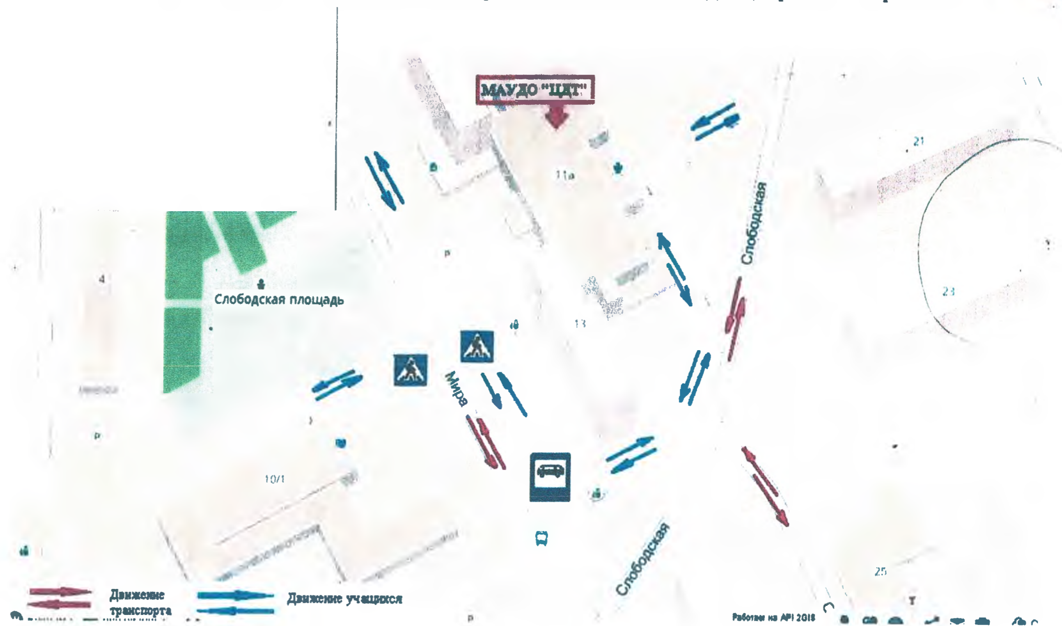
Схема организации дорожного движения в непосредственной близости от МАУДО «Центр детского творчества»